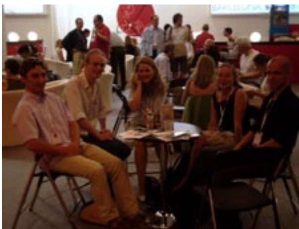
Eurodoc-Treffen in Barcelona anlässlich des European Science Open Forum