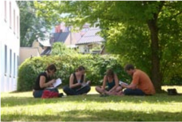
doktorat.at-Seminar in Bad Ischl, Juni 2008: Universitätsgesetzdebatte im Grünen