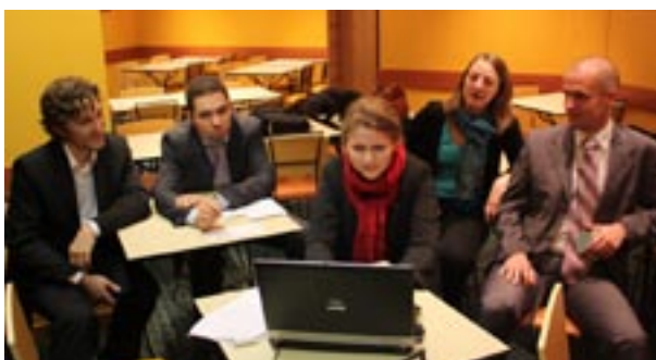
Konferenzvorbereitungen in Rennes